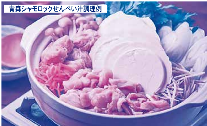
青森シャモロックせんべい汁調理例

①青森シャモロックせんべい汁セット 青森を代表するご当地グルメ「八戸せんべい汁」と青森の地鶏「青森シャモロック」を一度に堪能できる贅沢な鍋のセットです。