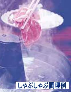
しゃぶしゃぶ調理例

青森県上北地区の広大な牧草地帯で仔牛を含めた2,200頭あまりの小川原湖牛は、様々な動植物が生産する恵まれた自然環境で育てられています。